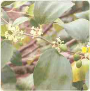
使用加倍生的試驗組，結果數量較多。