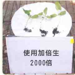
使用加倍生的試驗組，種子發芽成長速度較快速。