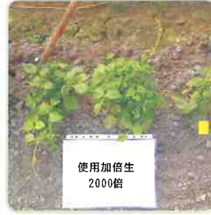
使用加倍生2000倍試驗組，生長速度與枝葉發展明顯較強健。