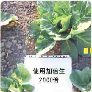
使用加倍生的試驗組，植株發育較快。