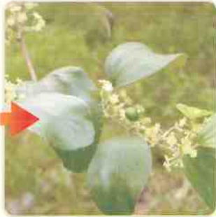
未使用加倍生的對照組，結果數量較少。