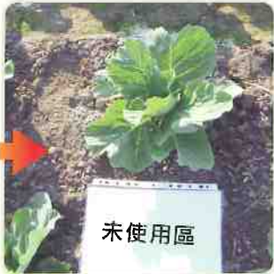
未使用加倍生的對照組，成長發育速度明顯較緩。