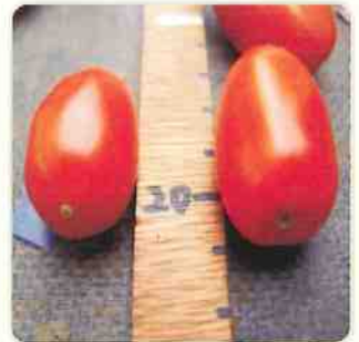
右側使用加倍生的試驗組比左側未使用區，果形更大、蒂頭較深。