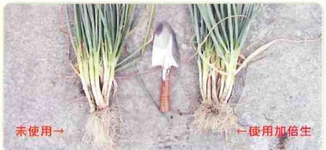
右側使用加倍生的試驗組，較左側的未使用對照組，其側根發展旺盛分株較多。