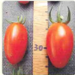
右側使用加倍生的試驗組，比左側未使用區，果柄較粗。