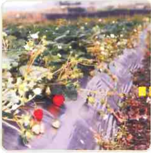
使用加倍生的試驗組，結果與開花數量明顯增加。