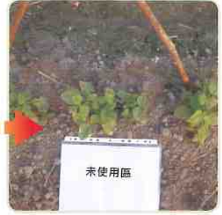
未使用加倍生的對照組，生長速度較緩慢，枝葉亦明顯較差。