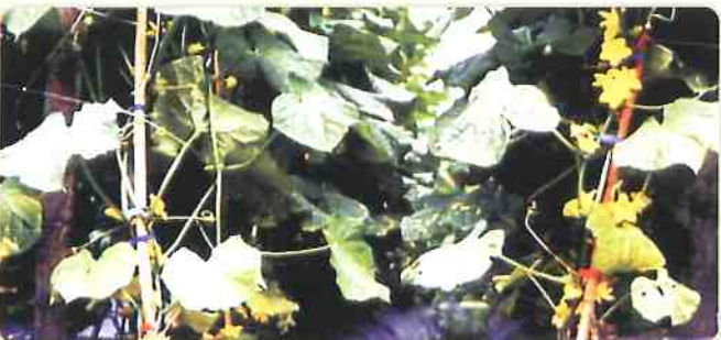
使用加倍生的右側試驗組，開花數較左側的未使用區增加許多。