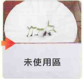
未使用加倍生的對照組，生長速度明顯較緩慢。