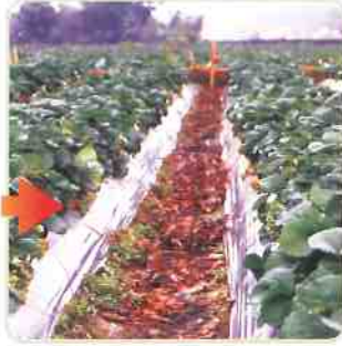
未使用加倍生的對照組，結果與開花數量明顯較少。